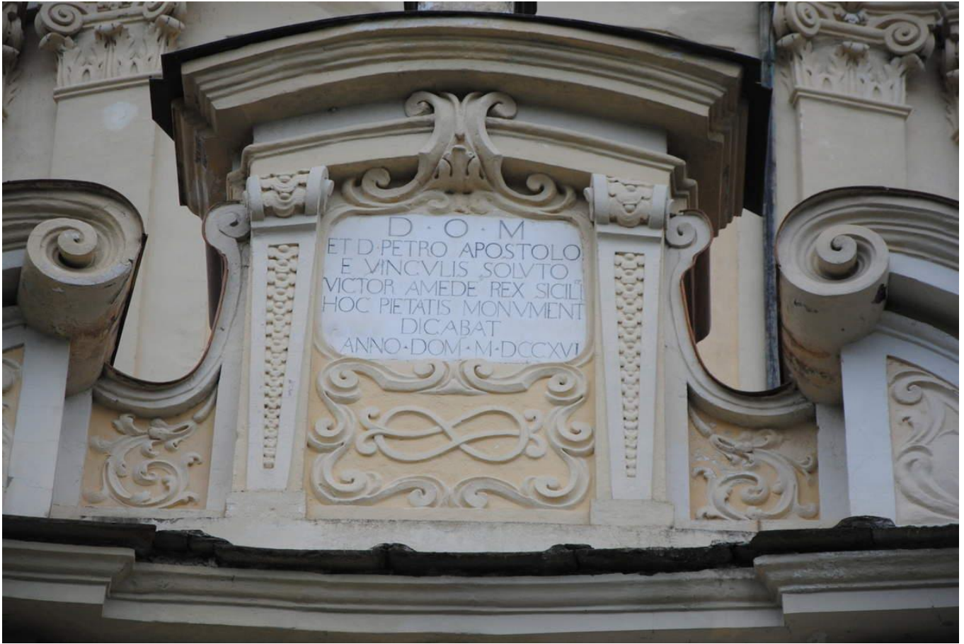
Dédicace de l'église Saint Pierre par Victor Amédée II devenu récemment roi de Sicile en 1716.