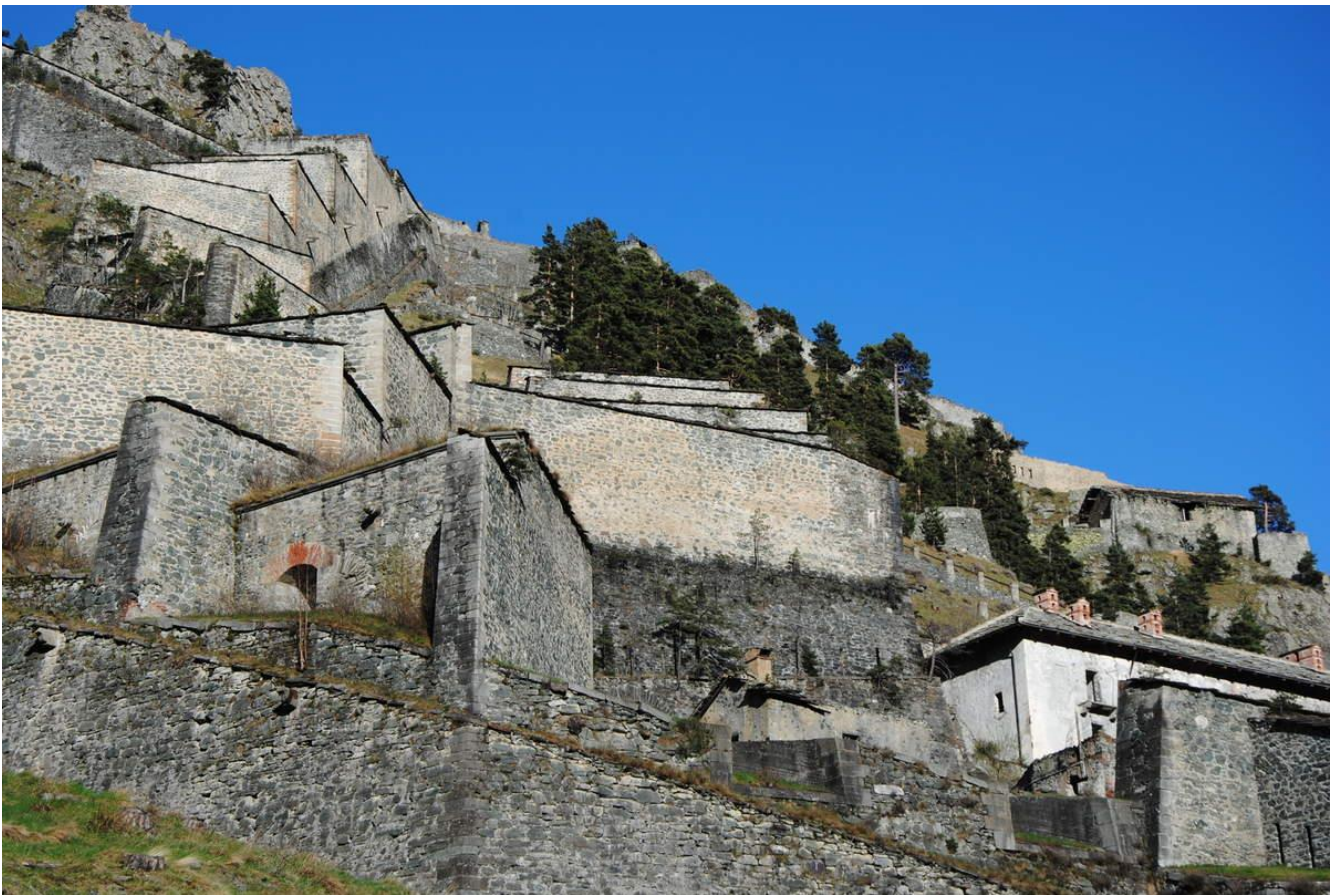
La partie médiane du Fort de Fenestrelle qui est considérée comme "la muraille de Chine du Piémont". La forteresse s'étage de 1100 mètre d'altitude à 1850 m.