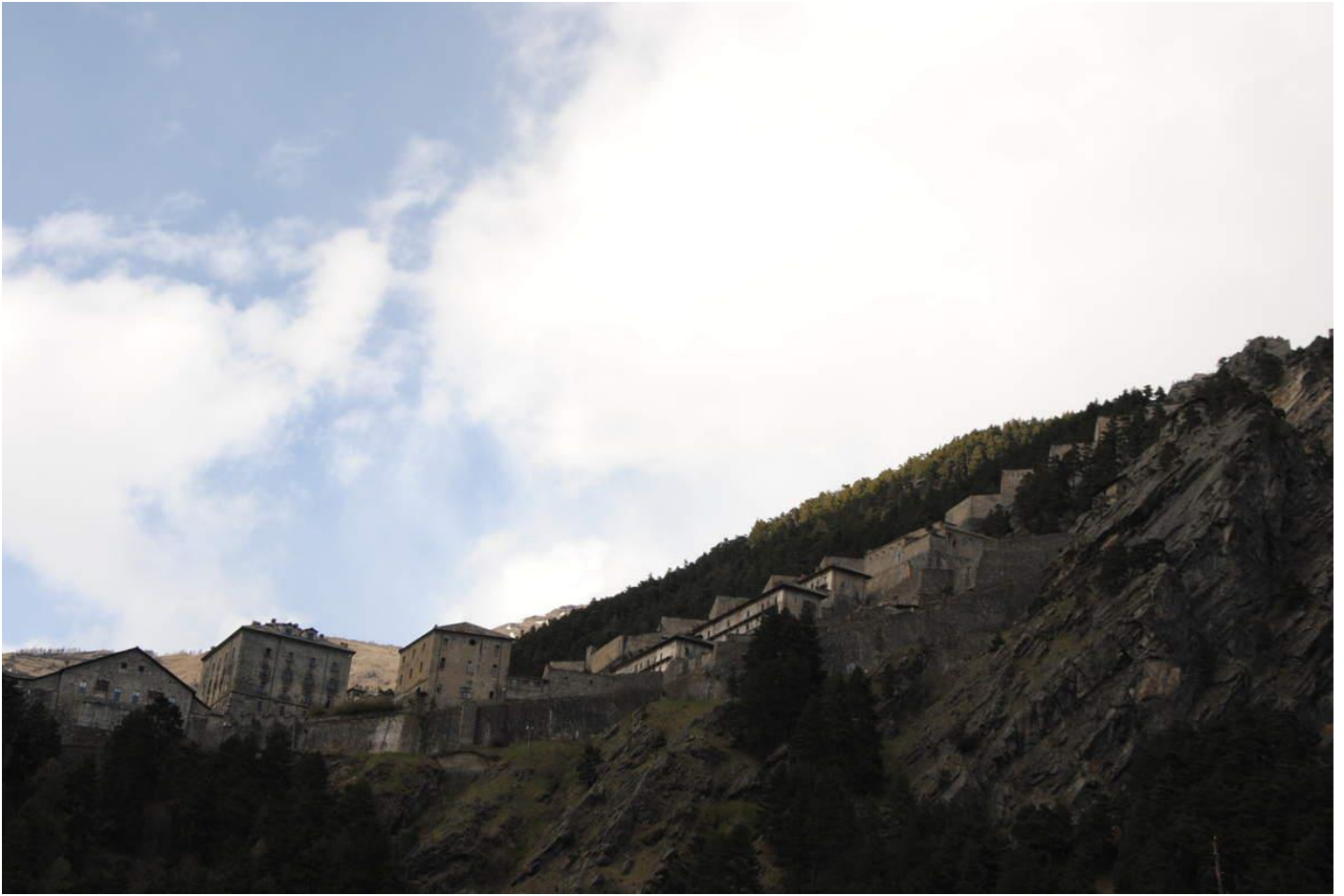
Une partie du fort Saint Charles

Au-dessus du dispositif du fort Saint Charles, à plus de 1800 mètres d'altitude fut construit le fort des vallées qui couronne l'ensemble du dispositif fortifié. Entre le fort Saint Charles, à 1200 mètres d'altitude et le fort des Vallées, on construisit une imposante muraille de 4 Km entrecoupée de deux redoutes et d'un autre petit édifice de protection.