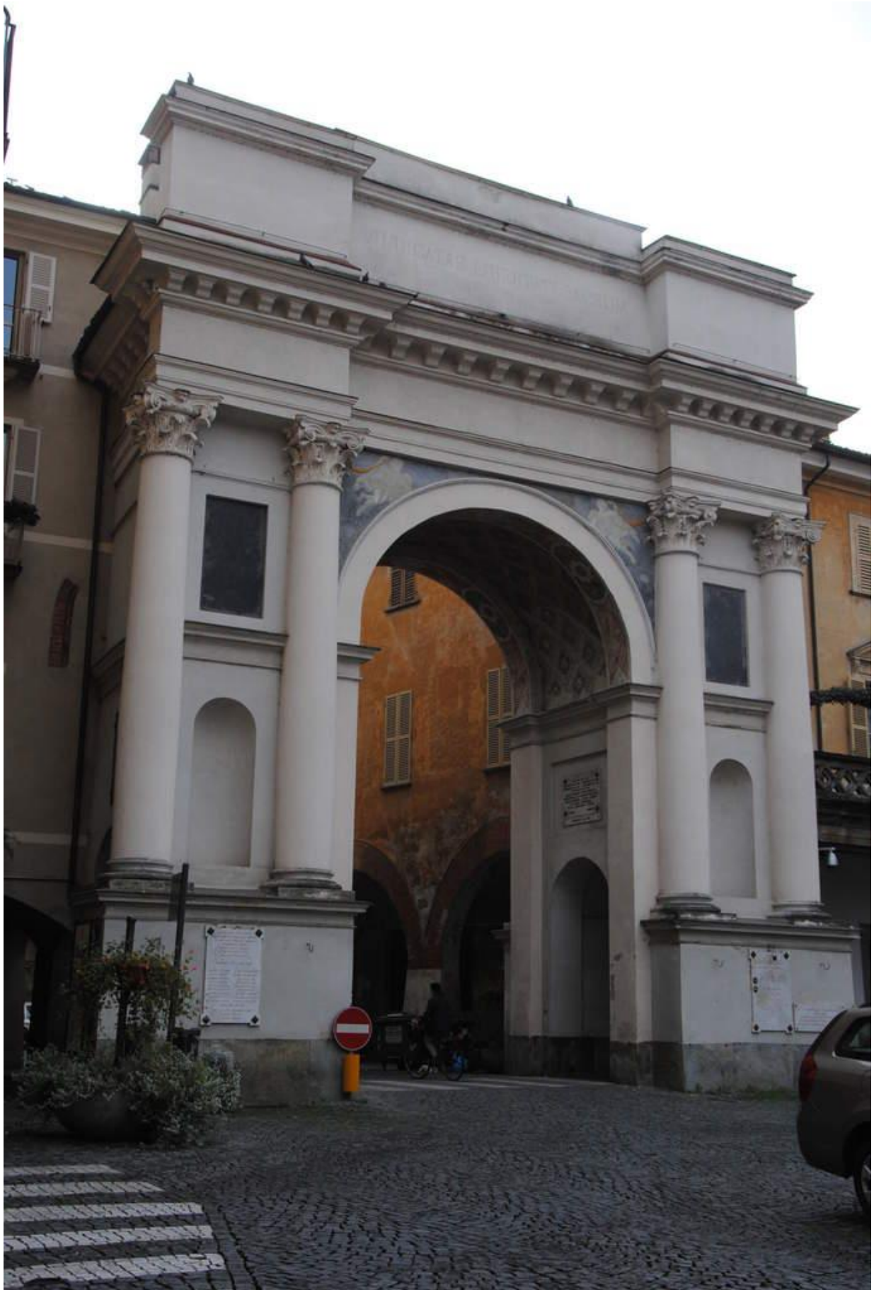
Arc de Triomphe de Savigliano construit en 1585 en l'honneur du duc de Savoie Charles Emmanuel 1er et de sa femme. La circonstance a été le retour du duc de Savoie qui venait de se marier à Saragosse avec la fille du roi d'Espagne Philippe II. Le couple, après s'être arrêté à Nice, réembarquèrent pour Savone où ils prirent le chemin du Piémont et de Turin.