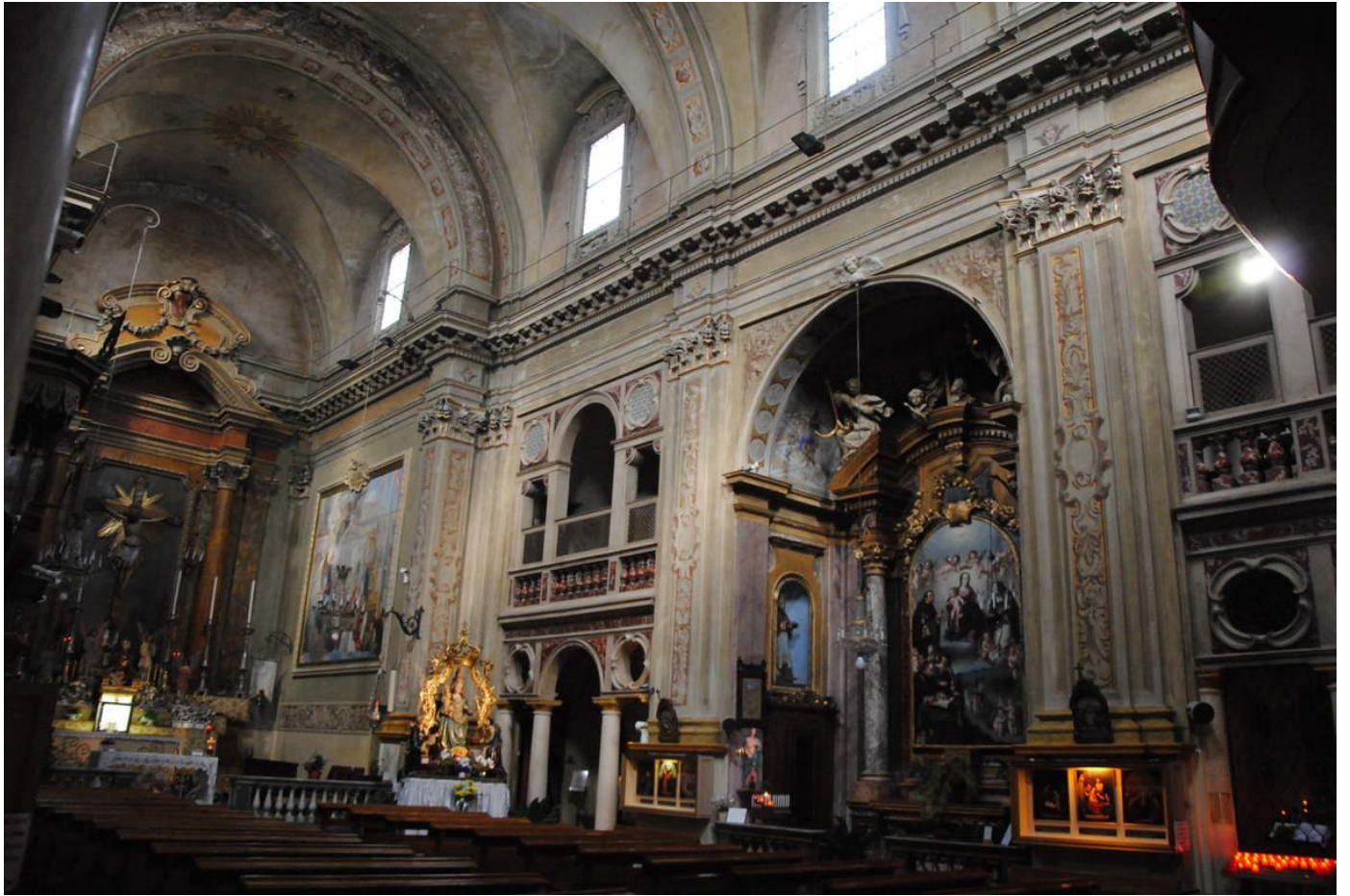
Eglise de la congrégation de San Filippo Néri de style Baroque. A remarquer la similitude avec l'église de Turin dessinée par Juvarra. Les oratoriens deviennent très puissants dans le duché de Savoie à la fin du XVII e siècle.