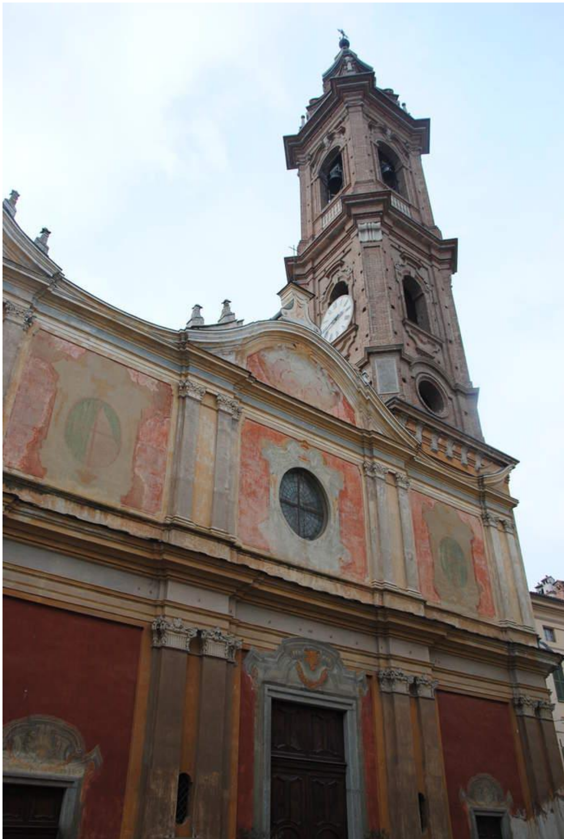
Collégiale Sant'Andrea et son campanile de style baroque.